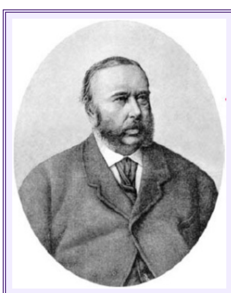
Ростислав Андреевич Фадеев