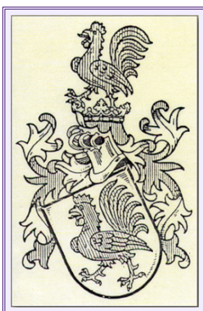
Родовой герб Ганов